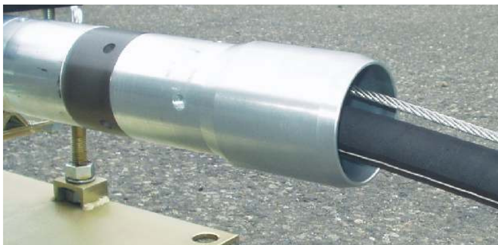
Der TERRA-HAMMER TU 068/75plus SK mit der Endhülse \varnothing 75 mm. Mit dieser Endhülse \varnothing 75 mm können HDPE-Rohre DA 63 mm auch in grösseren Längen eingezogen werden.