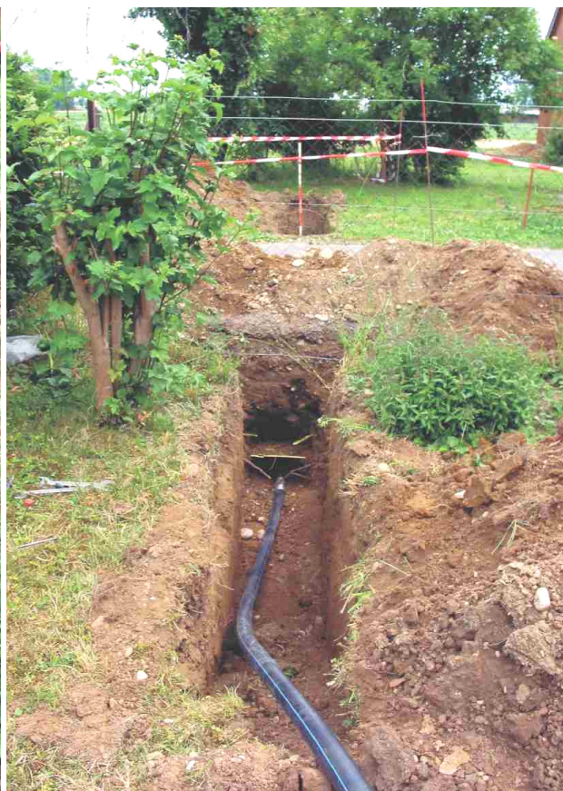
Das HDPE-Rohr DA 63 mm wird direkt mit dem TERRA-HAMMER TU 068/75plus SK eingezogen.