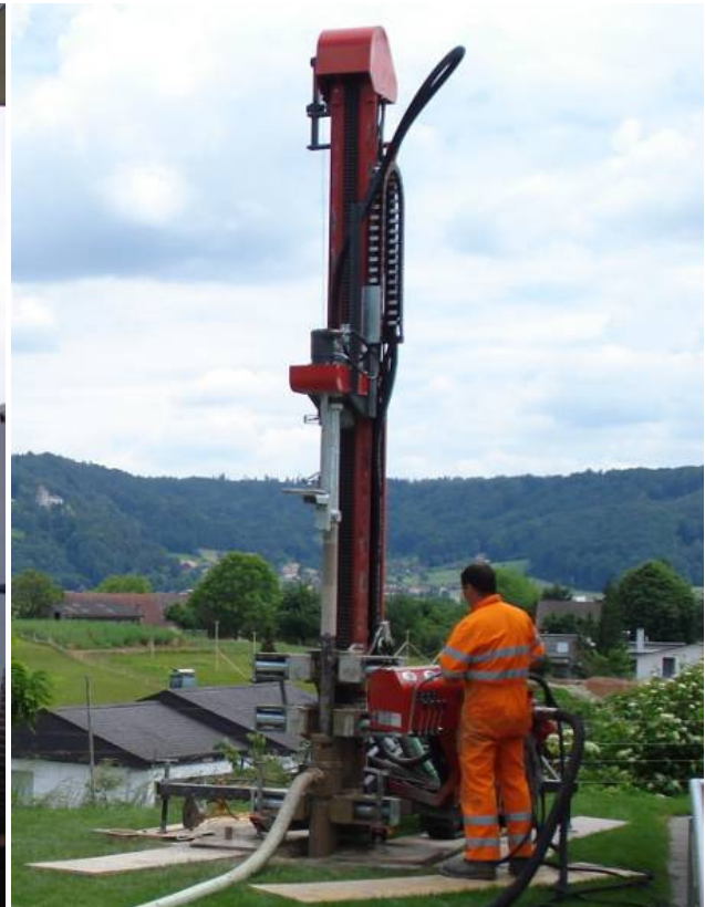
Die zweite Bohrung wird abgeteuft