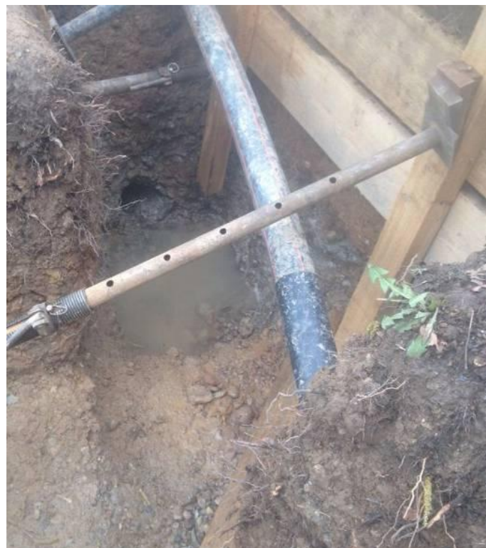
Bild 7: Die Pilotbohrung hat die Zielgrube erreicht. Der TERRA-ROCK 65 wurde ausgebaut und für die Aufweitung vorbereitet.