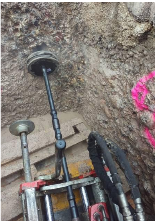
Bild 6: Ein Abstreifgummi auf der Bohrstange verhindert, dass die Grubenlafette durch das ausgeblasene Erdreich verschmutzt wird.