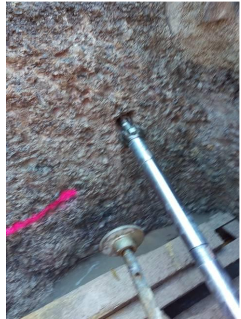
Bild 9: Solche Cuttings wurden vom TERRA-ROCK 65 abgebaut, von der Spülflüssigkeit aufgeschwemmt und vom Ausbläser den 20 m langen Bohrkanal nach hinten ausgetragen.

Bild 8: Der TERRA-ROCK 65 mit montierter Aufweitkrone. Diese Aufweitkrone dient zur stossenden Aufweitung des Bohrkanals.