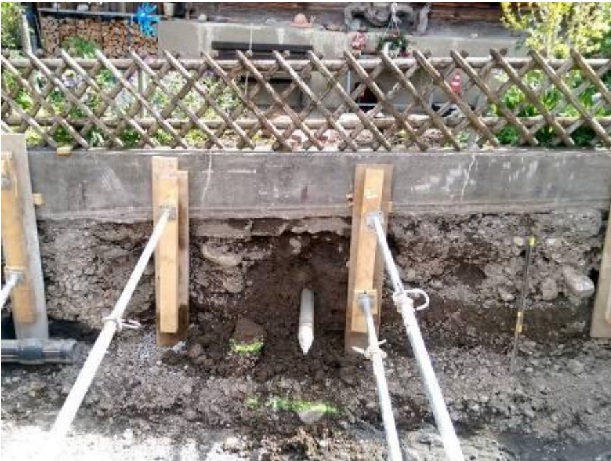
Bild 3: Die T 105 F erreicht problemlos und zielgenau die Grube der Hauptleitung.

Die Firma Gerber + Troxler Bau AG aus Bönigen erneuert in der Gemeinde das Trinkwassersystem. Für die grabenlosen Anwendungen, vor allem Hausanschlüsse, wurde die neue Erdrakete TERRA-HAMMER T 105 F eingesetzt. Mit spezieller übergrosser Endhülse erlaubt die 105 mm Erdrakete auch das Einziehen von grösseren Rohren wie hier ein 112 mm Kurzrohr. Die Erdrakete wurde in der Bruchsteinmauer des Kellers angesetzt und installierte gleichzeitig mit dem Durchschlagen unter dem 7 m Vorplatz die Kabelschutz-Kurzrohre. In diese Kabelschutzrohre wird anschliessend das Produktrohr installiert.