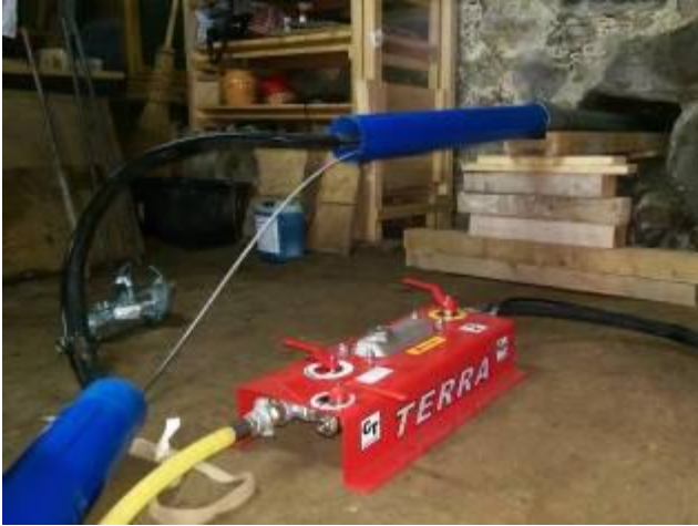
Bild 1: Installieren der Erdrakete und der Kurzrohre im Keller vor dem Starten der Erdrakete.