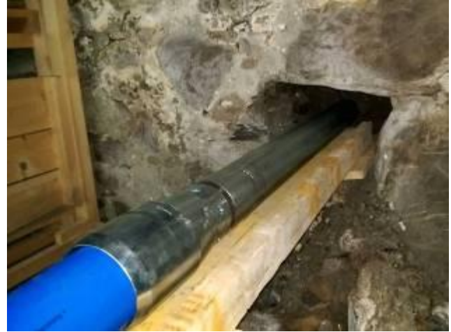
Bild 2: Die übergrosse Endhülse weitet den Bohrkanaal auf 130 mm auf.

Die Firma Gerber + Troxler Bau AG aus Bönigen erneuert in der Gemeinde das Trinkwassersystem. Für die grabenlosen Anwendungen, vor allem Hausanschlüsse, wurde die neue Erdrakete TERRA-HAMMER T 105 F eingesetzt. Mit spezieller übergrosser Endhülse erlaubt die 105 mm Erdrakete auch das Einziehen von grösseren Rohren wie hier ein 112 mm Kurzrohr. Die Erdrakete wurde in der Bruchsteinmauer des Kellers angesetzt und installierte gleichzeitig mit dem Durchschlagen unter dem 7 m Vorplatz die Kabelschutz-Kurzrohre. In diese Kabelschutzrohre wird anschliessend das Produktrohr installiert.