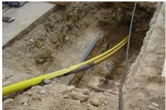
Der Seilberster wurde jeweils auf den Grubenrand gestellt, um das Neurohr in passender Länge nachzuziehen.