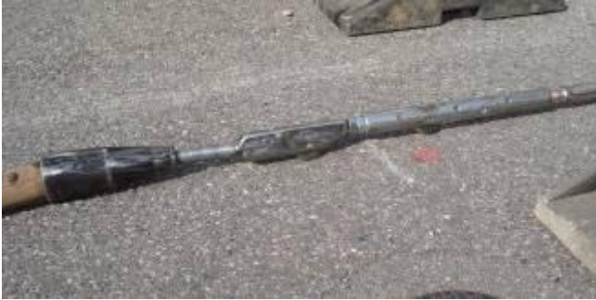
← Das Berstwerkzeug bestehend aus 2" Rollenmesser, Nachlaufschneidrad sowie Aufweitkonus Ø 100 mm.