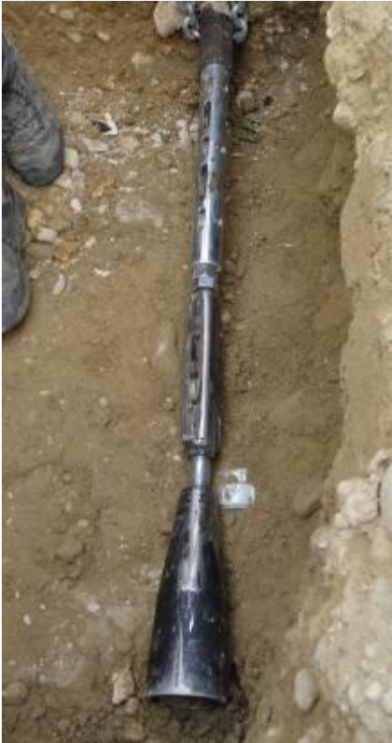
← Das Berstwerkzeug ist eingeführt in das zu schneidende Stahlrohr. Die Schneidrollen werden unten angesetzt.