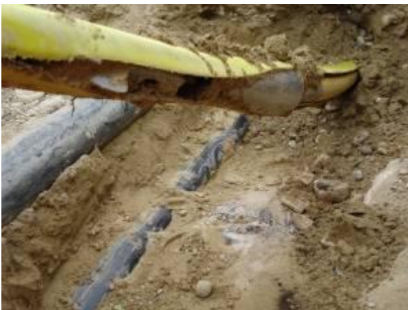
Das Berstwerkzeug mit angehängtem Neurohr kommt in der Zuggrube an.