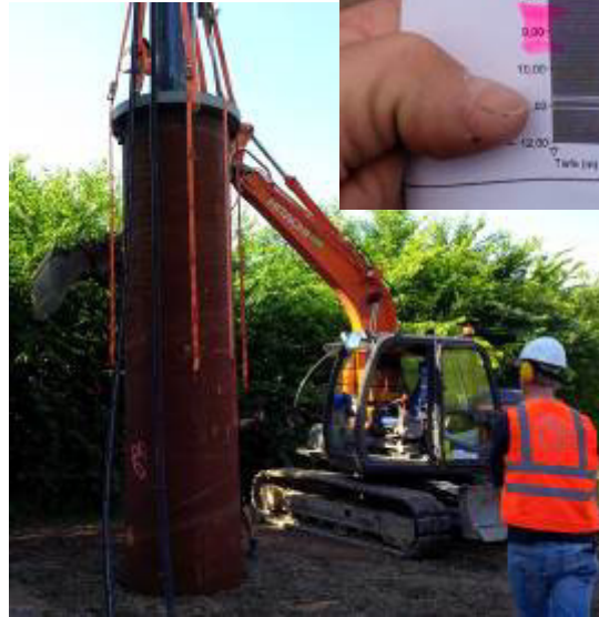
Während des Rammvorgangs wird die Position des Rohres ständig kontrolliert und angepasst. Da der Auftraggeber höchste Genauigkeit und Präzision erwartet.