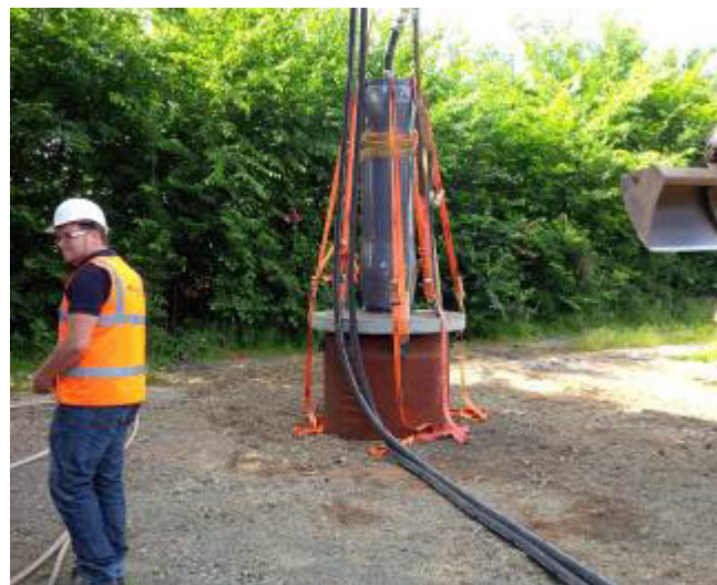
Nach Erreichen der endgültigen Tiefe wird die genaue Tiefenlage nochmals vermessen und vom Auftraggeber freigegeben. Der eigentliche Rammprozess dauerte lediglich 50 min, obwohl die enorme Rammkraft der TR 565 von 2'400 to nur zu 40% abgerufen wurde.

TERRA AG, Hauptstrasse 92, 6260 Reiden, Schweiz, Tel.: +41-62-749 10 10, Fax: +41-62-749 10 11 E-Mail: office@terra-eu.eu , Internet: www.terra-eu.eu