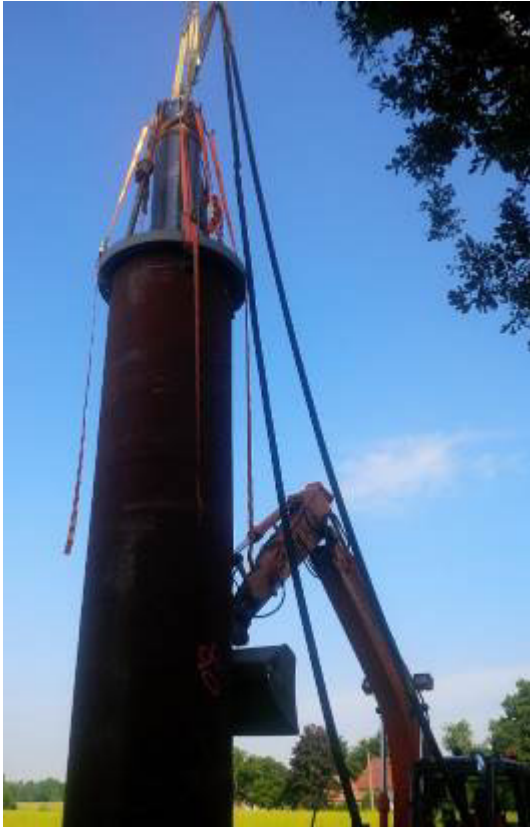
Die TERRA-Ramme TR 565 wird auf dem Stahlrohr positioniert und fest verbunden.

Das Bodenprofil zeigt bei 2.5 m und ab 8 m stark verdichteten Untergrund.