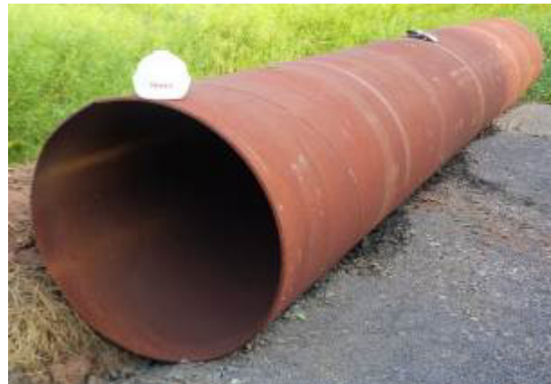
Das Stahlrohr Ø 1'200 mm wird vorbereitet und anschliessend vertikal mit dem Autokran in Position gebracht und ausnivelliert. Der seitliche Ringraum wird wieder verfüllt und verdichtet.