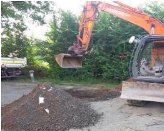
Die 2-3 m tiefe Grube für das Stahlrohr wird ausgehoben.

Eine eindrucksvolle Baustelle für den Neubau einer Signalanlage zeigt dieser Bericht. Die Aufgabenstellung war die Herstellung eines Mastfundaments mit einem Stahlrohr DA 1'220 mm. Dieses Stahlrohr wurde 10 Meter tief in den Boden eingerammt. Zu Beginn der Baumaßnahme wurde der Boden 2-3 Meter tief ausgehoben auf das spätere Niveau der Betonsohle, die bis zur Oberkante des Stahlrohrs das Fundament für die Aufnahme des Masts bildet.