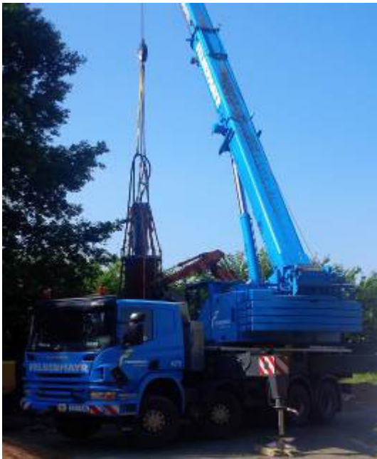
Der Autokran hält die TERRA-Ramme TR 565, die Rammplatte und das Stahlrohr in Vertikalposition.